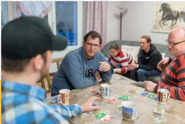
Wohnen heißt: Zuhause sein.